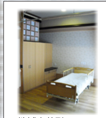
地域密着型 特別養護老人ホーム 居室 (4人部屋) photo#11