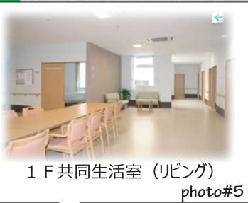
1 F 共同生活室 (リビング) photo#5