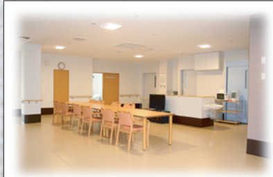
ユニット型個室 (60室) photo#7