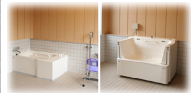
小浴&介助浴槽 (3か所あります) photo#6